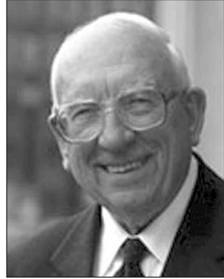
Thomas K (Ken) Whitaker, DEconSc: 1976-1997