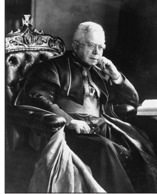
William J. Walsh, DD (Archbishop of Dublin): 1908 -1921