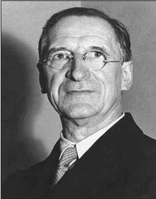
Eamon de Valera, BA BSc LLD PhD ScD FRC: 1921-1975